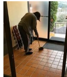
掃除も 自分で行います