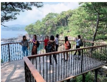
海を初めて見る実習生も！