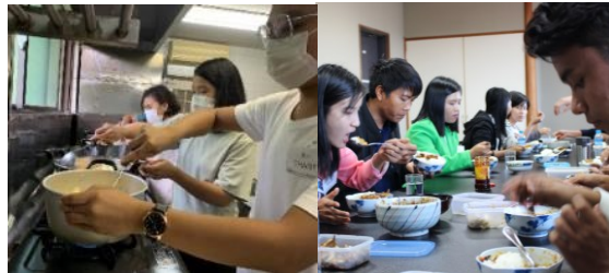
自炊生活を組合が支援 (お米は食べ放題！他、差し入れ多数)