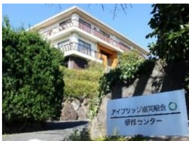
海が見える高台に建つ アイブリッジ研修センター