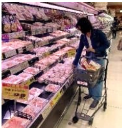
近くのスーパーで 買い物