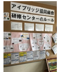
様々なルール を学びます